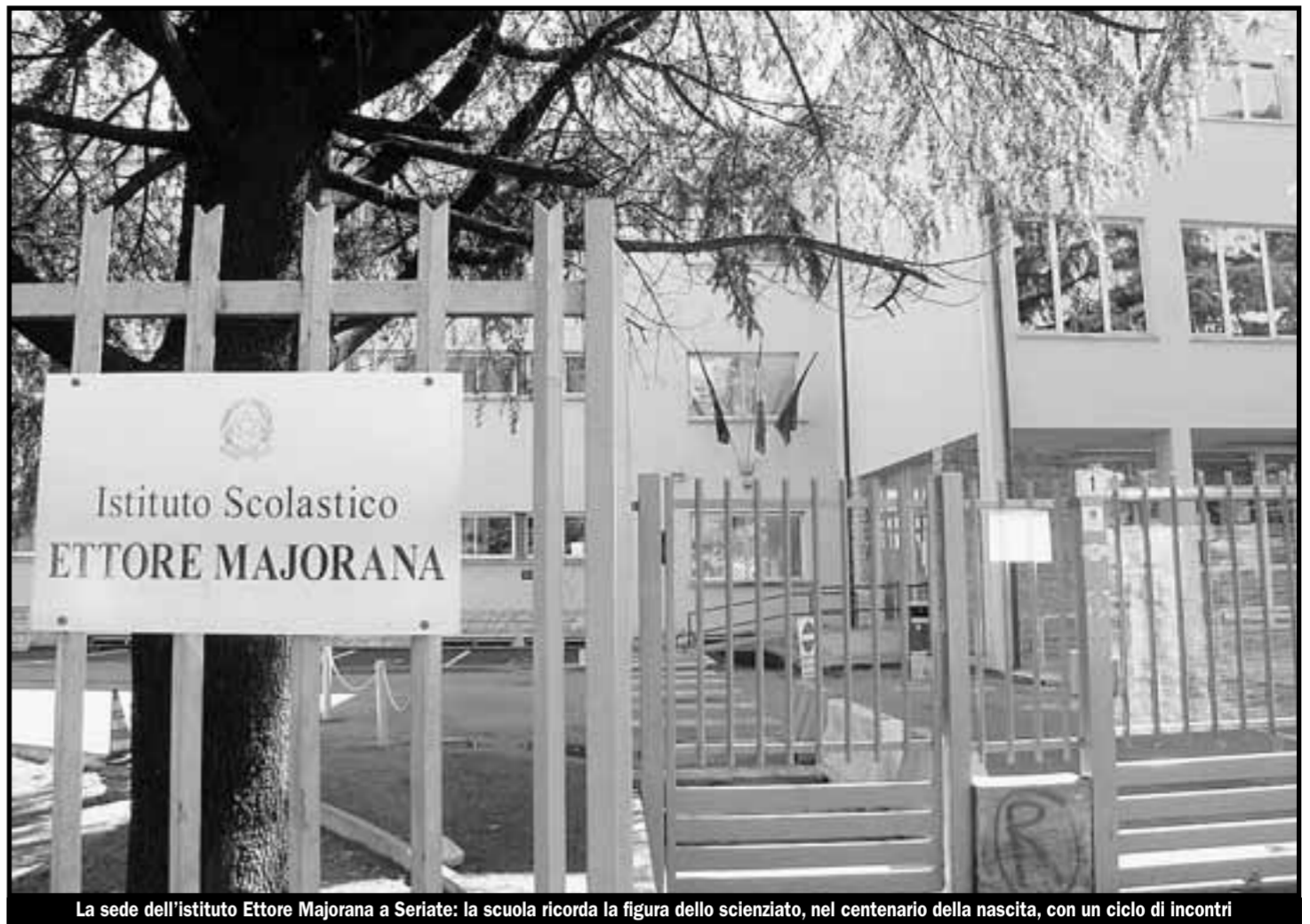
La sede dell'istituto Ettore Majorana a Seriate: la scuola ricorda la figura dello scienziato, nel centenario della nascita, con un ciclo di incontri